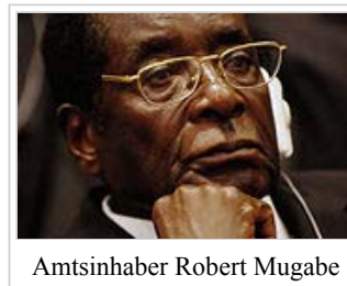
Amtsinhaber Robert Mugabe