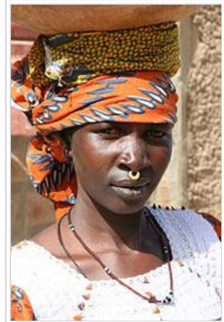
Peul-Frau in Mali

Nachtrag zur Einleitung: Allein in Guinea gibt es mindestens 4 Millionen Fulbe/Pheul/Fula. Laut Wikipedia-Seite "atlantische Sprachen" "18 Mio Muttersprachler, 22 Mio mit Zweitsprechern" im Raum Senegal/Guinea/Mali mit angrenzenden Gebieten. Das einzige Land, in dem die Fulbe das (relative) Mehrheitsvolk sind, ist Guinea (40% Bevölkerungsanteil oder mehr). D. Preissler