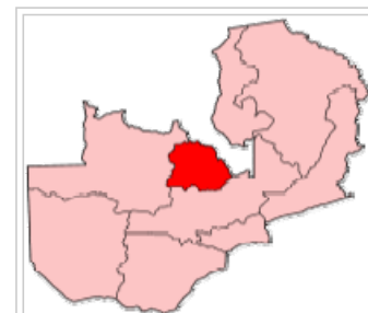
Die geographische Lage der Copperbelt Province

Er liegt in der Copperbelt Province von Sambia. Deren Hauptstadt ist Ndola, andere Städte sind unter anderem Kitwe, Chingola, Nchanga, Mufulira, Solwezi, Luanshya, Kalulushi, Chililabombwe und Chambishi. Sie sind alle von der Montanindustrie (Zechen bzw. Hütten) geprägt. Die rein ländlichen Distrikte Lufwanyama, Masaiti und Mpongwe liegen südlich und außerhalb des eigentlichen Copperbelt. Die Copperbelt-Provinz hat 1.581.221 Einwohner (Zensus 2000) und umfasst 31.328 km².